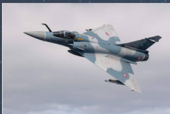
Un Mirage en plein vol

L'Armée de l'Air est l'une des quatre composantes des Forces Armées de la République Française, les autres composantes militaires étant l'Armée de Terre, la Marine Nationale et la Gendarmerie Nationale.