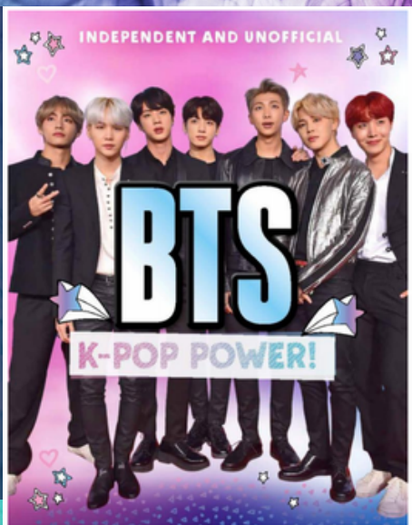
BTS: V, SUGA, JIN, JUNGKOOK, RM, JIMIN ET JHOPE ...

BTS (aussi appelé bangtan sonyeondan ou 방탄 소년단 en coréen) est un groupe de musique Kpop sud-coréen, originaire de Séoul. Il a été formé en 2013 par Big Hit Entertainment. Il est constitué de 7 membres: Rap Monster (RM), Jin, Jimin, J-Hope, V, Suga et Jungkook. Le nom du groupe, Bangtan Sonyeondan, est une combinaison de 방탄 qui signifie bulletproof (pare-balles) et 소년단 qui signifie boy scout.