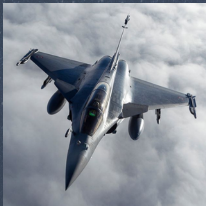
Un Rafale en mission contre DAECH