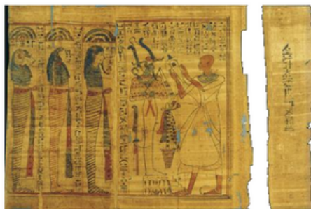
Exemple d'un papyrus égyptien

« Un livre qu'on quitte sans en avoir extrait quelque chose est un livre qu'on n'a pas lu. » - Antoine Albalat