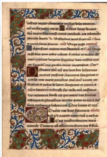
page manuscrite en latin avec lettrine et marge enluminées

Un livre peut servir à faire voyager ceux qui n'en n'ont pas les moyens, d'entrer dans une nouvelle dimension, de voyager dans le temps, de nous plonger dans l'irréel, de développer notre imagination, d'être meilleur en orthographe... Comme le dit Julien Green : « Un livre est une fenêtre par laquelle on s'évade. »